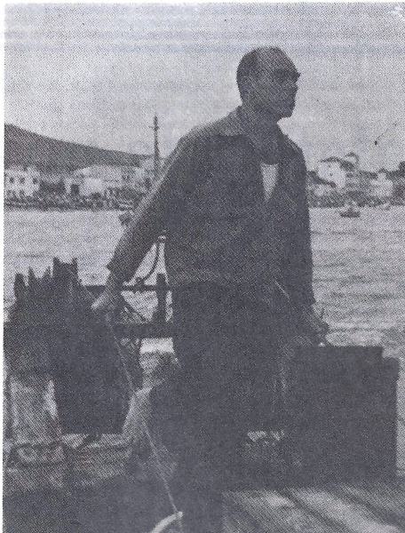
En Papiol, l'any 1956, quan encara menava el seu bastiment, davant de la seva estimada platja de Calafell.

Però quan era calma aprofitàvem l'oratge de la nit. Calafell era la millor mar d'aquesta costa, perquè, de nit, de davant de casa fins a Barà, sempre tirava la terrària, mentre que a la Torre i als Pans (davant de Segur) era calma blanca. Per això, aquí als Pans el peix sempre estava reposat i ple perquè no es podia pescar.